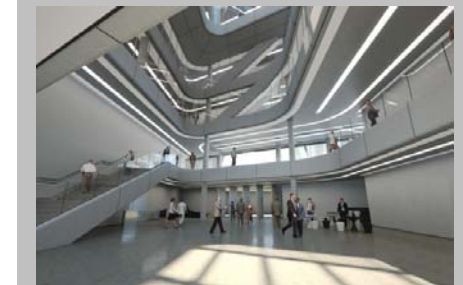
Spiral Tower, Zaha Hadid, Barcelona

Panduan ini merupakan revisi dari Panduan Tugas Akhir Jurusan Arsitektur Universitas Islam Indonesia yang disusun oleh Ilya F. Maharika, Yulianto Prihatmaji, Hanif Budiman, dan didukung oleh kontribusi dari Hastuti Saptorini, Revianto B. Santosa dan Dewan Dosen Arsitektur.